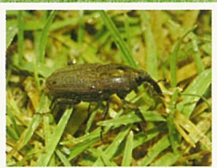
シバオサゾウムシ