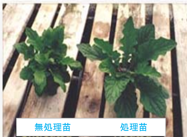
サイマトEZ処理のガーベラは根が発達し、地上部も大きくなった

サイマトEZ(イージー)はアメリカのアクアトロール社が、グリーンハウスやナーセリー産業での生産性向上を目指して、40年以上に及ぶ開発努力の結果、生まれた、新しい培養土専用の水管理資材サイマトリックを生産現場で使い易いよう、日本で物理性を調整したものです。